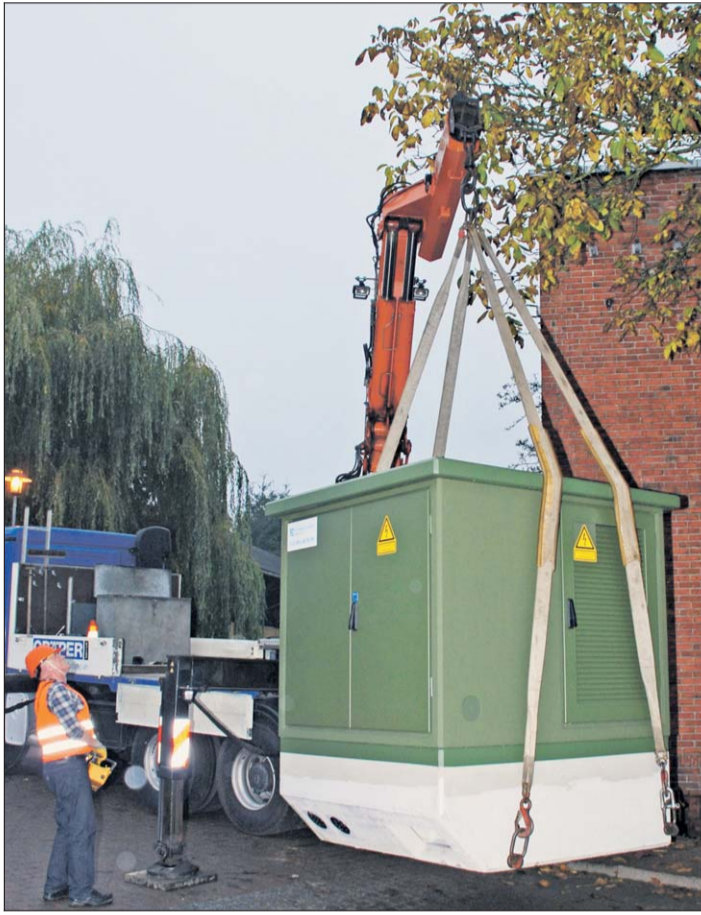
Die neue Trafo-Station schwebte neben dem Turm im Wittenborner Steindamm ein.